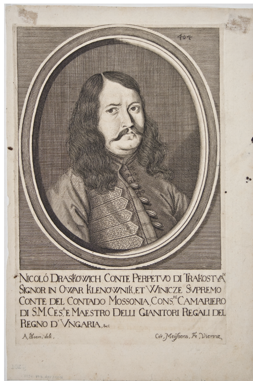
Slika 2 Nikola II. Drašković crtao Adriaen van Bloemen, rezao Cornelius Meyssens, Beč, 17. stoljeće kupljeno od Mirka Breyera iz Zagreba 1905. godine Hrvatski povijesni muzej, inv. br. HPM/PMH 3301

Zbirka je do kraja 19. stoljeća obogaćivana najčešće darovima. U čitavoj povijesti Muzeja tek je pet portreta naručeno za Zbirku – početkom druge polovine 19. stoljeća sabirnom su akcijom prikupljena sredstva za portrete Josipa Jelačića i Franje Josipa I. te su oni naručeni kod slikara Ivana Zaschea (Jablonec, Češka, 1825. – Zagreb, 1863.), pristigla iz Beča u Zagreb na poziv nadbiskupa Haulika kako bi slikao park Maksimir. 4 Zasche je također naslikao portrete biskupa Haulika i Dragutina Rakovca. Godine 1871. Muzej je od slikara Josipa Franje Mückea (Nagyatád, Mađarska, 1819. – Pecs, 1883.) 5 bio naručio portret biskupa Strossmayera.