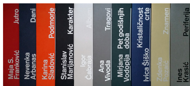
Slika 4 Izdanja Kabineta grafike HAZU