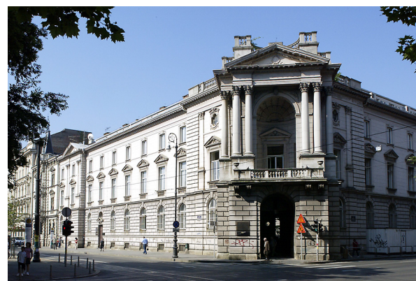
Slika 1 Sjedište Kabineta grafike HAZU