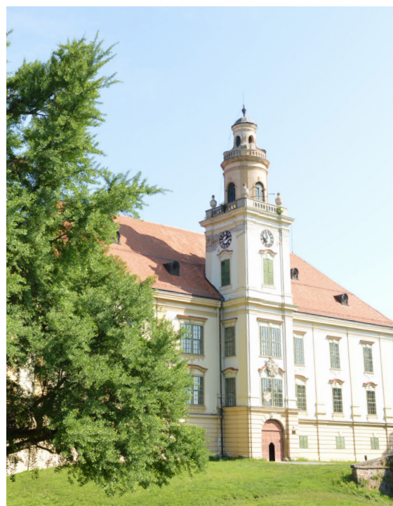
Slika 1 Dvorac obitelji Hilleprand von Prandau i Normann-Ehrenfels u Valpovu