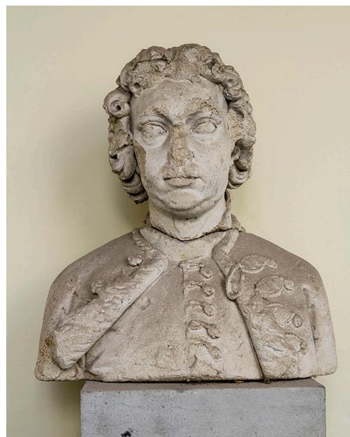
Slika 5 Poprsje Adama Zrinskoga, 17./19. st. kamen pješčenjak, 80 × 74 × 28 cm, Čakovec, Muzej Međimurja Čakovec, inv. br. MMČ 6014, foto: Jovan Kliska