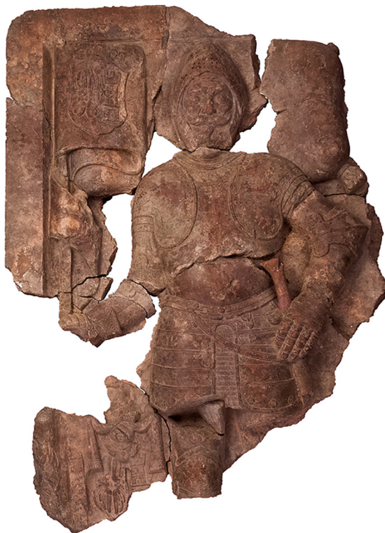
Slika 2 Nadgrobna ploča Nikole IV. Zrinskoga (†1566.) (?) mramor, 162 × 115 × 22,5 cm, Čakovec, Muzej Međimurja Čakovec, inv. br. MMČ 11564