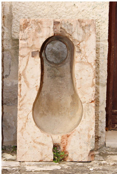
Slika 19 Kamena školjka nužnika iz sklopa Dragazzo