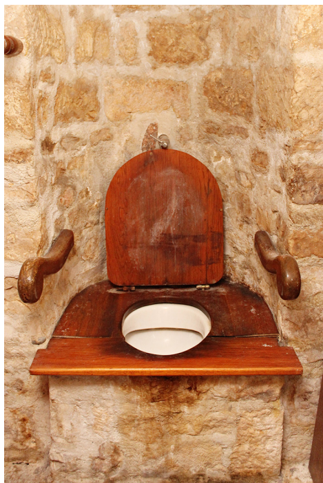
Slika 20 Kameni nužnik iz palače Garagnin-Fanfogna