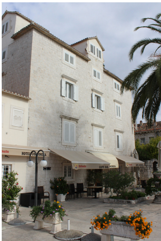
Slika 16 Hotel Concordia