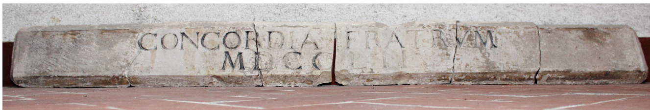
Slika 15 Originalni natpis s pročelja kuće Sasso