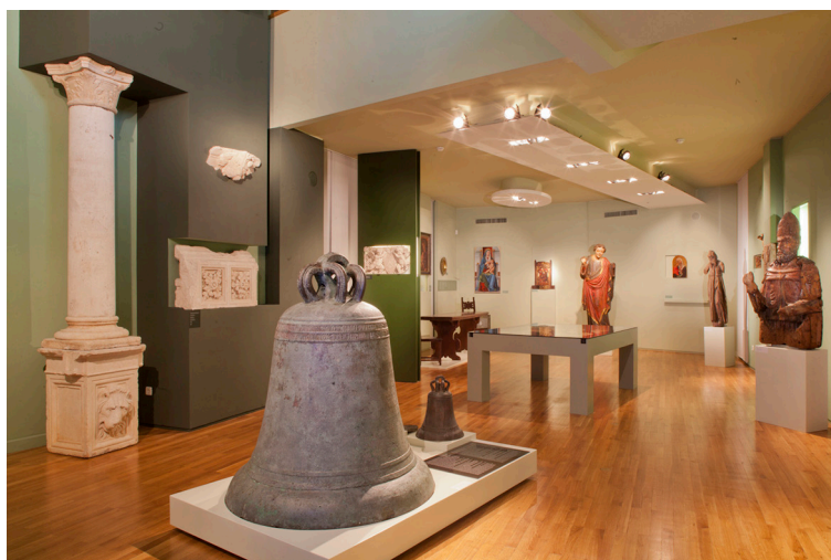
Slika 2 Arhitektonsko- kiparski studio Katedrale svetog Jakova