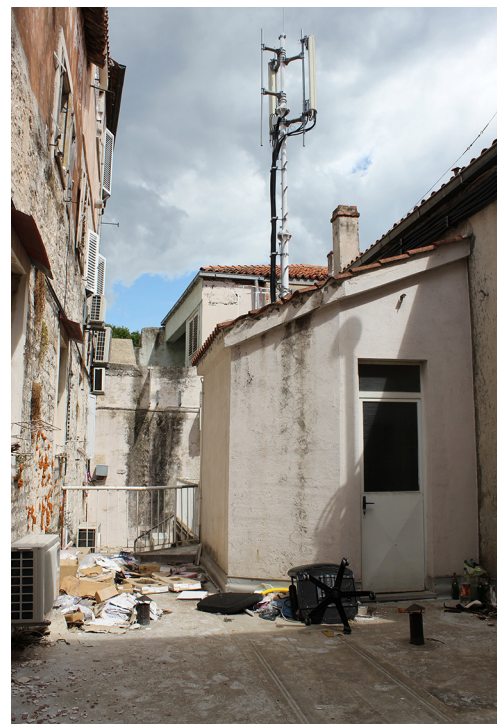
Slika 1 Primjer devastacije: betonska terasa nad dvorištem

Devastacije, bespravne gradnje, odnosno nelegalne građevinske intervencije u povijesnoj jezgri Trogira još nagrđuju i uništavaju grad kao jedinstvenu cjelinu. Sveudilj i naveliko gradi se bez dozvole; dižu se čitavi katovi od bloketa ili pak od betona. Uništava se krovni pokrov od kupa kanalice na mnogim kućama i zamjenjuje betonskim terasama (sl. 1, 2, 2a, 3). Probijaju se mnogobrojni otvori za prozore i vrata, i to bez kamenih okvira. Drvene vratnice i prozori mijenjaju se onima od plastike i aluminija (sl. 4). Uništava se i pločnik. Onaj pred sjevernim gradskim vratima, uz blagoslov konzervatora, zamijenjen je novim kamenim pločama. Recentno su betonirani posljednji vrtovi i dvorišta. Život u gradu postaje sve teži, ako ne i nemoguć; ugostiteljske radnje zagađuju bukom; uzurpiraju se javni prostori, trгови i ulice. 6 Ekonomija se svela na samo jednu djelatnost – na turizam, koji ima i negativne efekte na okoliš.